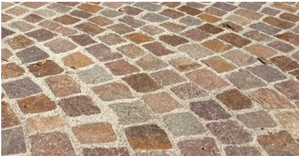
Figura 3 - Cubetti di profido del Trentino

Il progetto prevederà impiego dei seguenti materiali per la realizzazione delle opere