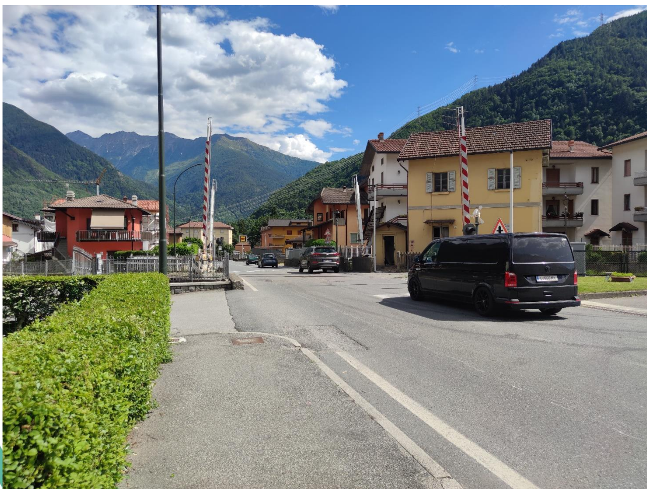
Figura 1 - Particolare marciapiede esistente

La situazione attuale dell'area oggetto di intervento si contraddistingue per la presenza di una serie di marciapiedi in cattivo stato di conservazione, realizzati in manto bituminoso, con cordoli in calcestruzzo, per lo più rovinati. Si sottolinea inoltre la presenza di un sistema di scolo delle acque meteoriche soggetto a intasamenti per la natura stessa della soluzione, i cordoli con caditoia.