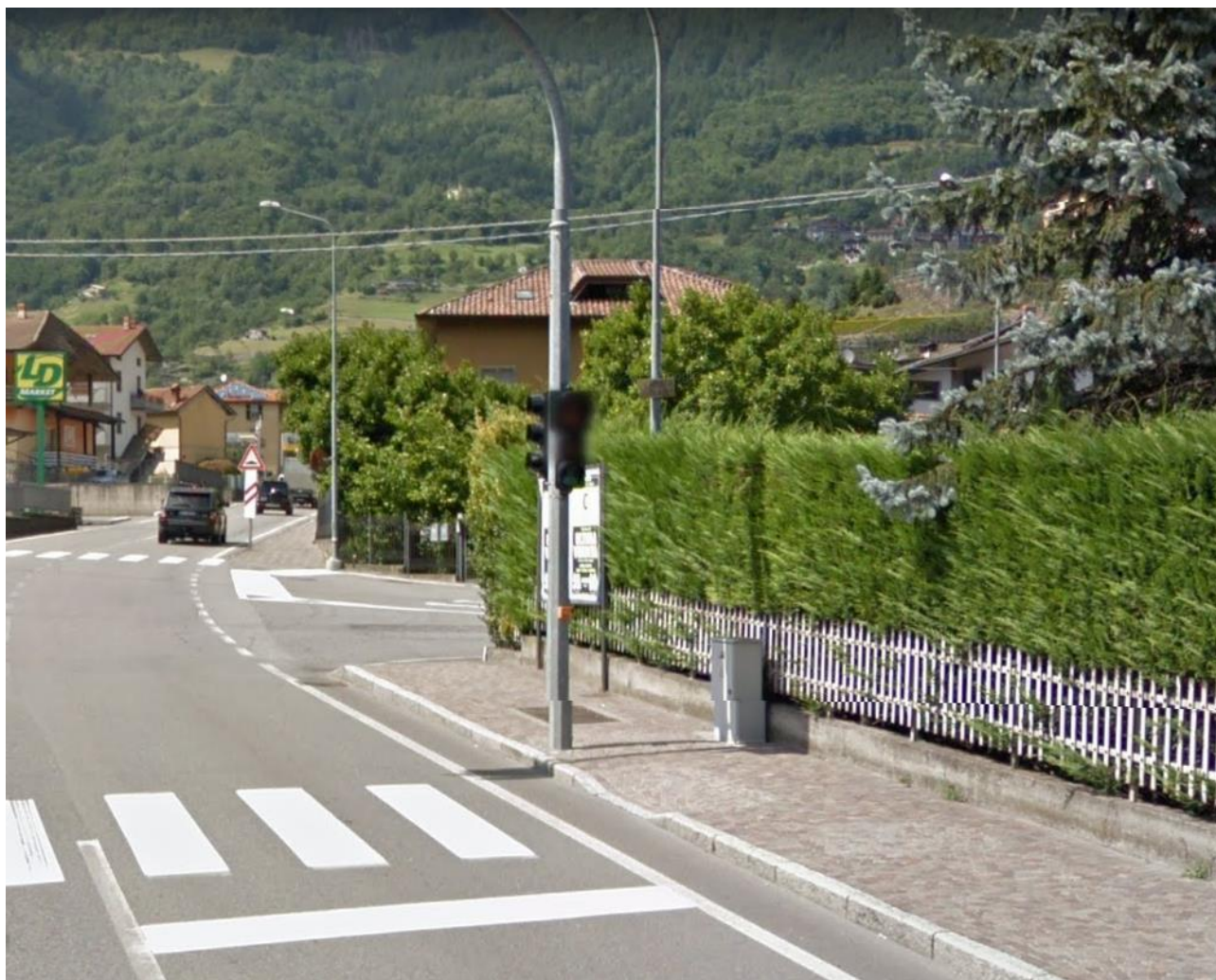
Figura 5 - Esempio di tratto stradale già riqualificato in analogia a quanto proposto